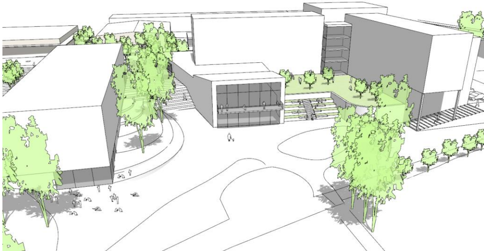
Bilder ur gestaltungsförslaget: Jais Arkitekter - Nisse Landén