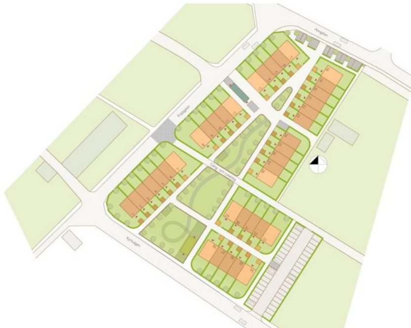
Situationsplan över planerad bebyggelse

Förslaget är att förlänga avtalet till och med 2024-09-30 under samma förutsättningar som i tidigare markanvisningsavtal för fastigheten.