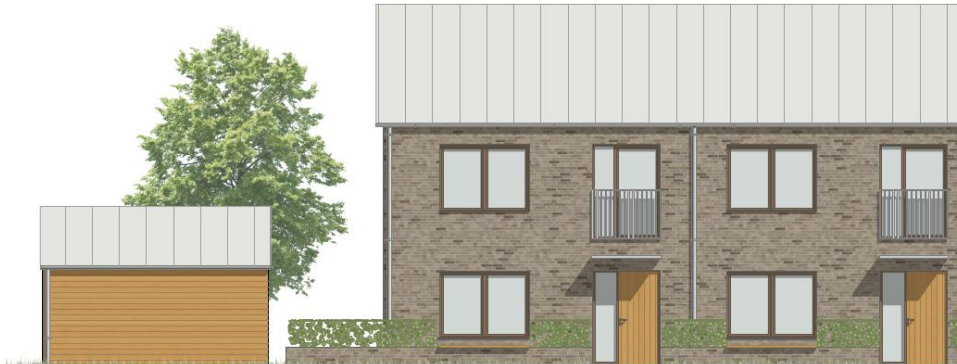
Illustrativ fasadskiss. Huvudbyggnader i tegel och komplementbyggnader i trä.