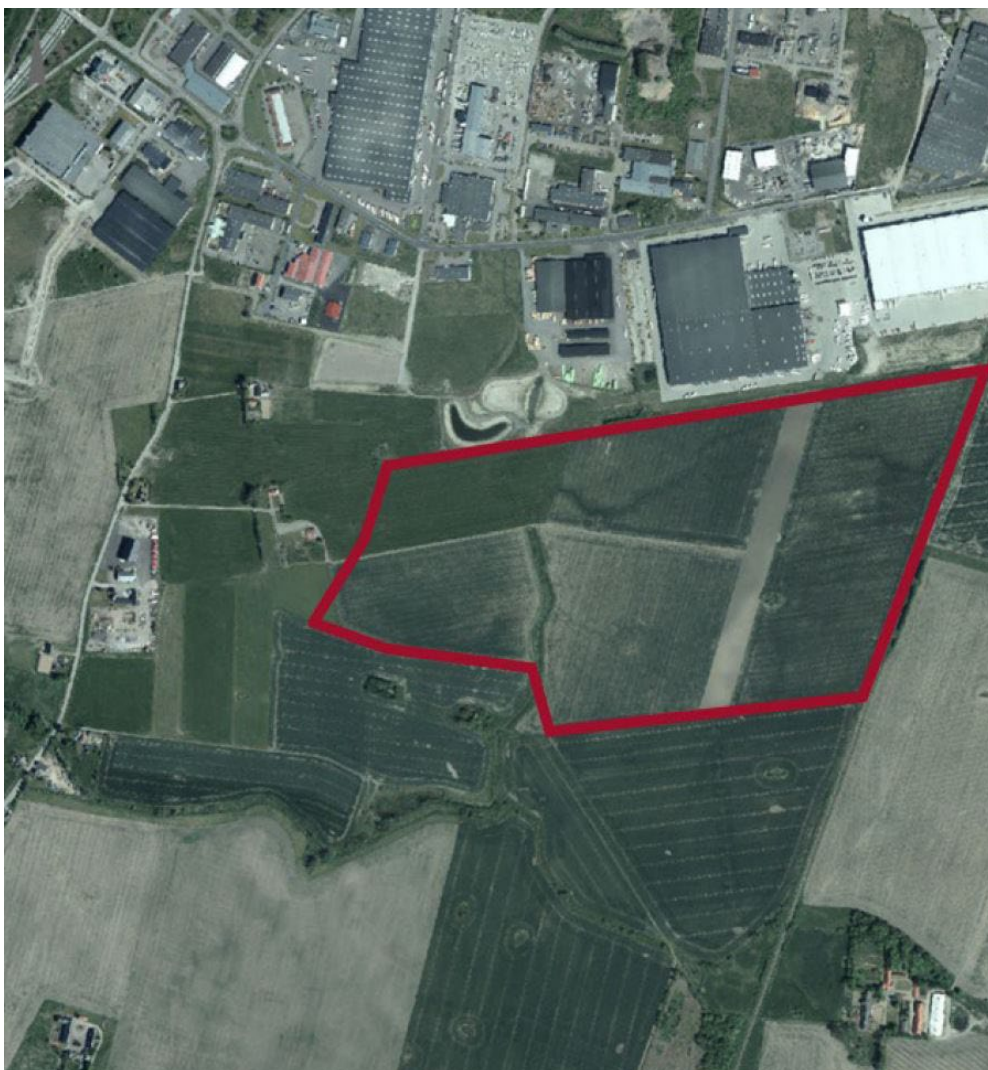
bild på planområdet.

Planarbetet finner stöd i gällande översiktsplan. Grå avgränsning redovisar utpekad område för planerat verksamhetsområde.