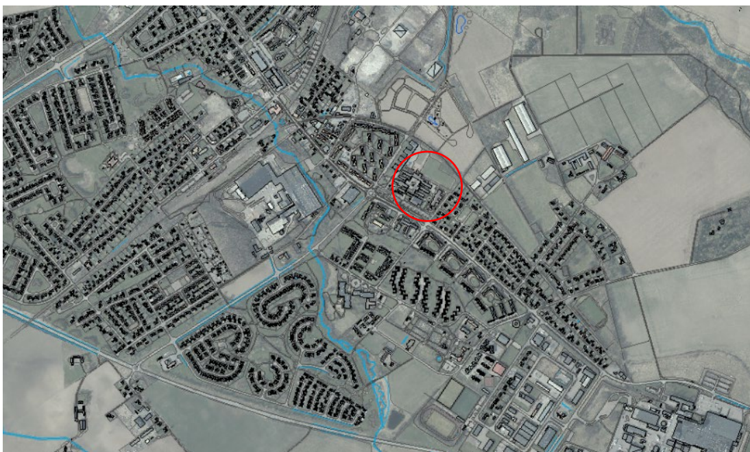
Rektorn 1 i Bjuvs tätort.

Området som berörs är fastigheten Rektorn 1 i Bjuvs tätort. Idag gäller Förslag till ändring av stadsplanen för del av fastigheten Bjuv 8:1 mm i Bjuvs köping 12-BJS-49 från 1960 tillsammans med tomtindelning 1260K-64 från 1964. Äldre stadsplaner och tomtindelningar gäller i dag som detaljplaner. Inom fastigheten ligger Varagårdsskolan.