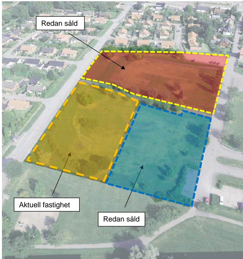
Vy över grönytan med Billesholm station uppe till höger i bild, Västergatan till vänster om markerat område och Skolgatan till höger.