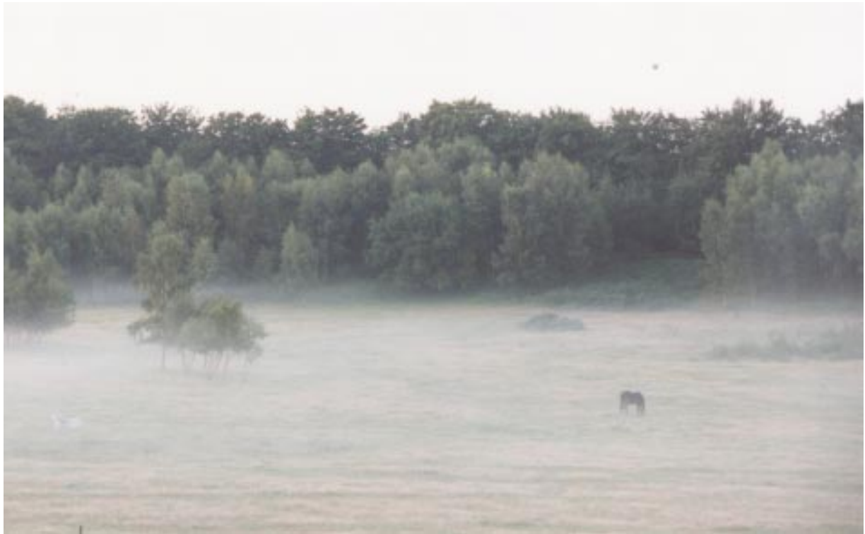
Betesmarkerna på Söderåsen är en viktig kulturprodukt med lång tradition på Söderåsen. De är också viktiga element för skönhetsupplevelsen i landskapet.