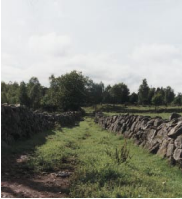
Fägata - ett viktigt kulturelement från ett äldre jordbrukslandskap

Konga gård. Norr om byn ligger Konga lund som legat här i alla tider och fungerat som jakt- och ollonskog åt Knutstorps ägare.