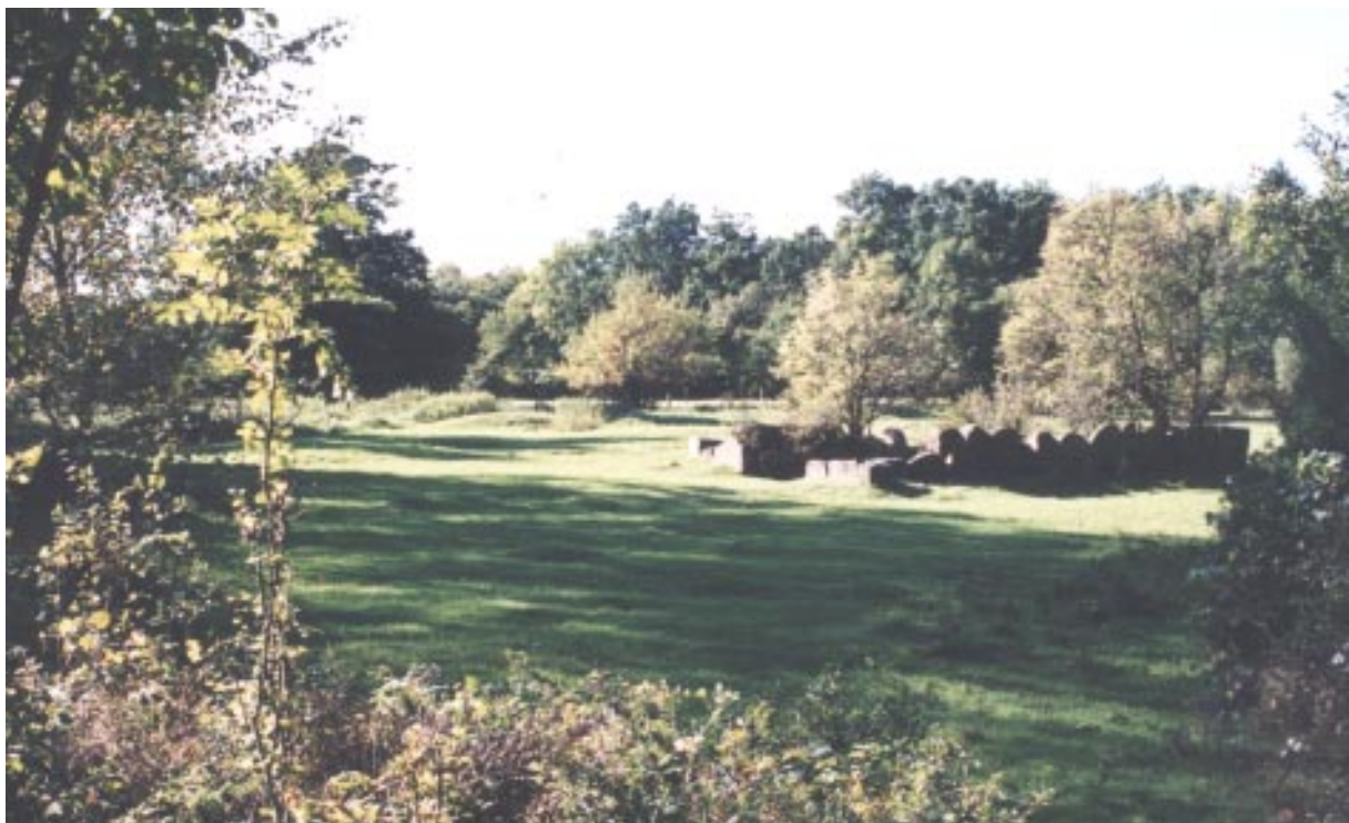
Ruinerna efter Båvs hus i Båvs hage

På bronsåldern (2000 f kr-400f kr) när människorna blev fler röjde man fram ny åkermark genom svedjning och röjning. Detta s.k. vandrande åkerbruk gav en röjgödslingseffekt vilket var den tidens gödselteknik. Innan man sådde rensades dessa marker på sten och lades i odlingsrösen eller röjningsrösen. Inom den blivande nationalparken på Söderåsen ligger två grupper av odlingsrösen i slutningen som är daterade från denna tid