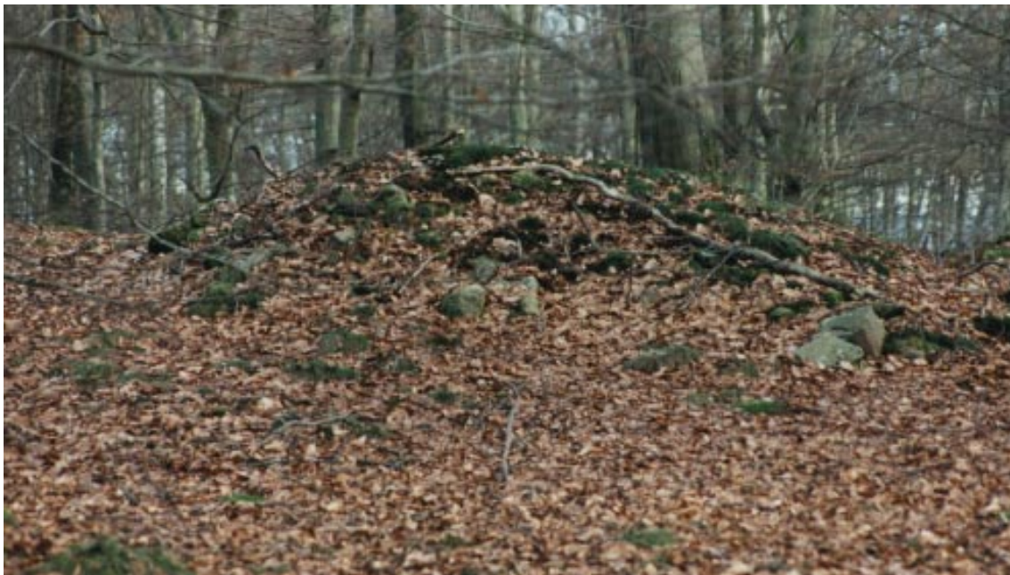
Ett av Söderåsens många odlingsrösen.

Stenestads kyrkby, Klåveröd och Konga kyrkby med intilliggande naturmiljöer.