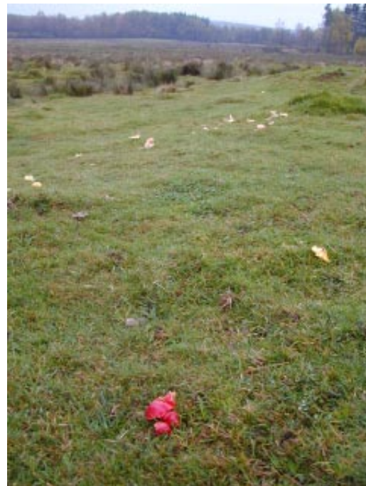
Naturbetesmarken - den kanske äldsta kulturmarkstypen. Den är värdefull både som natur- och kulturmiljö.

Sammanfattningsvis kan man säga att viktiga händelser som skapat dagens landskap är 1800-talets skiftesreformer, användningen av fossila bränslen, konstgödselanvändningen och granskogsbruk.